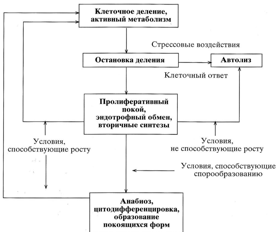
Рисунок 1. Метаболические превращения клеток микроорганизмов [1]

В полной мере сказанное относится и к проблеме персистенции бактериальных патогенов в т.ч. хламидий – адаптивной стратегии выживания вида в условиях инфекции.