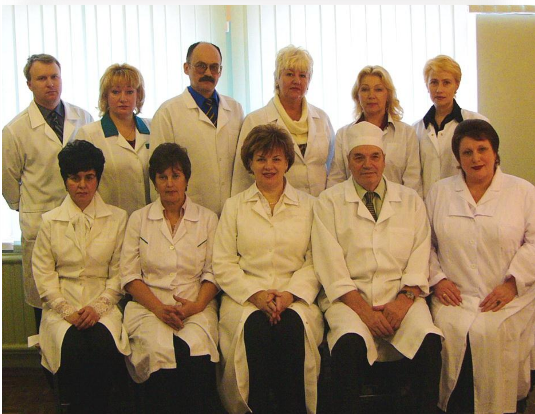
Кафедра акушерства, гинекологии, перинатологии и репродуктологии